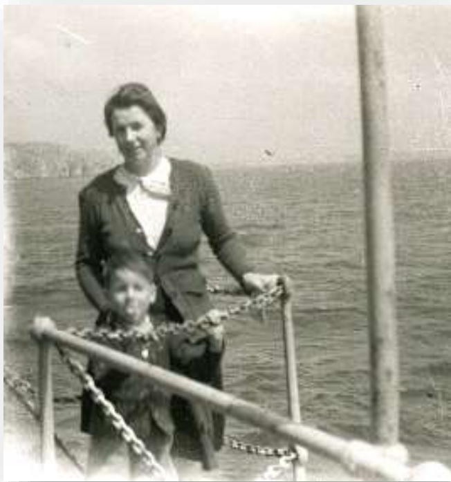
Au large du Portugal le Cap St Vincent