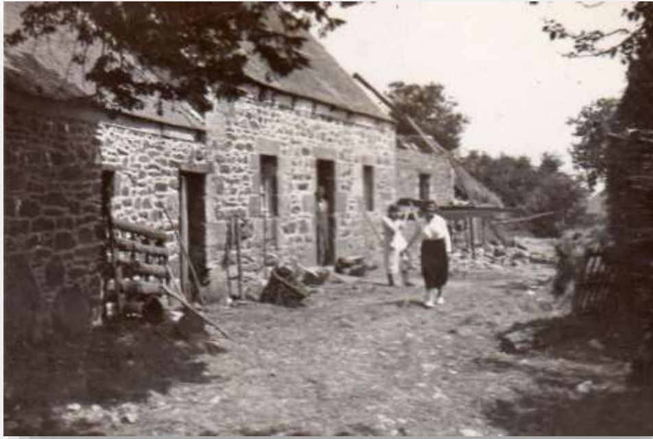
La ferme de Coat ar Rest sur la commune de Scrignac (Finistère)

Mon grand-père et ma grand-mère étaient des paysans bretons qui loin d'être riches vivaient dans une ferme qu'ils possédaient près de Scrignac dans le Finistère au lieu-dit Coat Ar Rest. Ils eurent sept enfants.