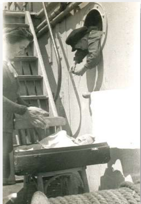
Sur le bateau Annie dans sa valise

Le retour en France se fait sur un cargo mixte le PLM 17, qui passe par Gibraltar, le Havre et remonte la Seine jusqu'à Rouen.